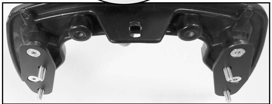
Montage bei Verlegung nach oben Mounting when installed upwards

Nun die vormontierten C-Bows samt Sechskantschrauben M6x18 mit den selbstsichernden Muttern M6 sowie U-Scheiben Ø6,4 an den C-Bow Haltern verschrauben.