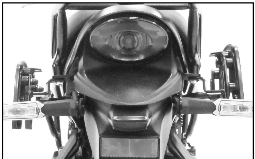
Beispiel: links ohne C-Bow Verlegung / rechts mit C-Bow Verlegung Example: left without C-Bow shifting / right: with C-Bow shifting

If a C-Bow holder is already mounted, the C-Bows must be dismantled. The screws are omitted, the washers are reused.